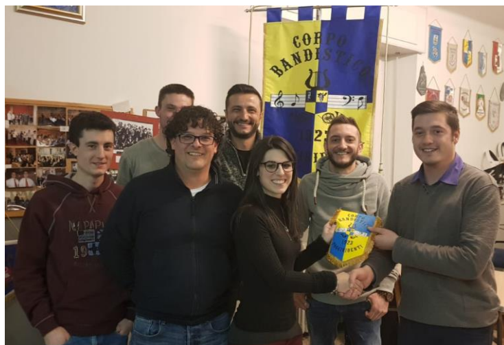
Foto di gruppo del nuovo direttivo del Corpo Bandistico di Poggiridenti