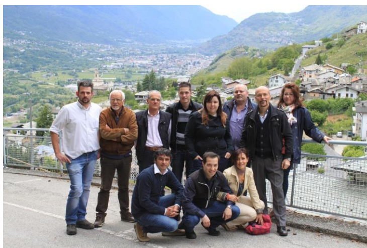
Foto di gruppo di tutti i componenti della squadra di maggioranza che hanno contribuito a governare nel quinquennio 2014 -2019 il Comune di Poggiridenti

priva di compromessi, ma schietta e ricca di contenuti, volta a dare alle esigenze dei cittadini di Poggiridenti L'UNICA CENTRALITÀ DI UN IMPEGNO AMMINISTRATIVO . Oltre a quanto sopra riportato, che rappresentano in linea sintetica il nostro operato eseguito nel quinquennio un ringraziamento va a tutte le associazioni che operano nel nostro territorio, Pro Loco, Avis, Polisportiva, Alpini, Associazione San Fedele e Banda e a moltissimi volontari , che hanno sempre dimostrato con i fatti e non solo a parole l'attaccamento al proprio paese alle proprie radici , creando i presupposti per un paese Vivo e Solidale , attraverso delle bellissime iniziative rivolte a sostenere e ravvivare il nostro territorio, con iniziative culturali, turistiche, ludiche, ricreative, sportive, musicali e sociali. Un vero cuore pulsante in un contesto di una società rivolta al consumismo e al relativismo, dove i social fanno la loro parte, svuotando in buona parte i valori fondamentali della nostra società. Un sincero ringraziamento va anche a tutto lo staff Amministrativo ed operativo che grazie alla loro professionalità e dedizione ci hanno permesso di raggiungere in buona parte gli obiettivi che ci eravamo prefissati. Non per ultimo un doveroso ringraziamento va a tutti i componenti della mia squadra Amministrativa , che hanno collaborato con dedizione ed impegno, compatibilmente con i mille impegni familiari e professionali per il bene collettivo e per la crescita del proprio paese .