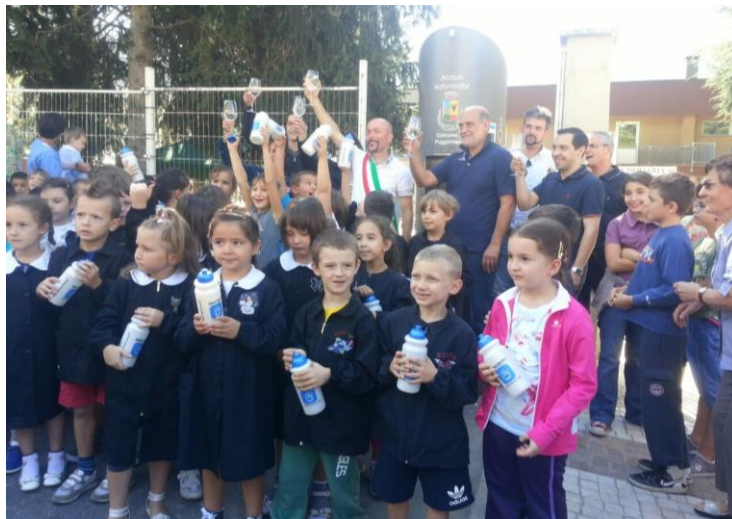
Inaugurazione del fontanello ecologico a Poggi piano antistante l'ingresso della scuola avvenuta il 12 settembre 2014